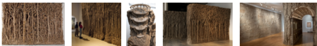
Travail d'Eva Jospin (son médium est le carton)

Pour les plus jeunes, faire raconter l'histoire.